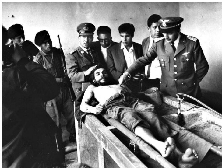
◉ CHE MORTO: "O dia que me queiras" é uma pesquisa sobre a última foto tomada de Che, já morto