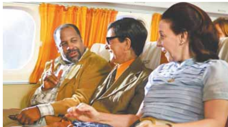
TRÊS FASES de Chico: cinebiografia cobre a vida de um dos mais importantes médiuns brasileiros, da infância até o fim da vida