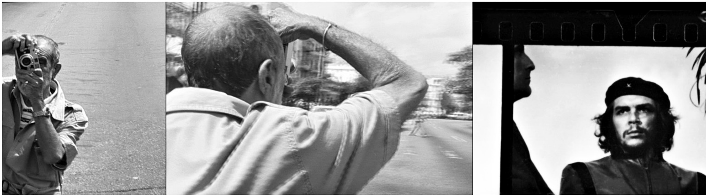
➤ Che - Olhares no Tempo: "Kordavision", documentário de Hector Cruz Sandoval, é um dos destaques da mostra que está na programação do Cine Ceará