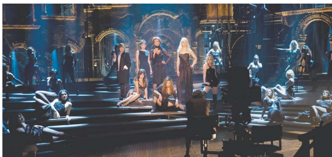
OS MAIS INDICADOS: "Amor sem Escalas", com George Clooney, está presente em seis categorias do Globo de Ouro, seguido de perto pelo musical "Nine", dono de um dos melhores elencos do ano