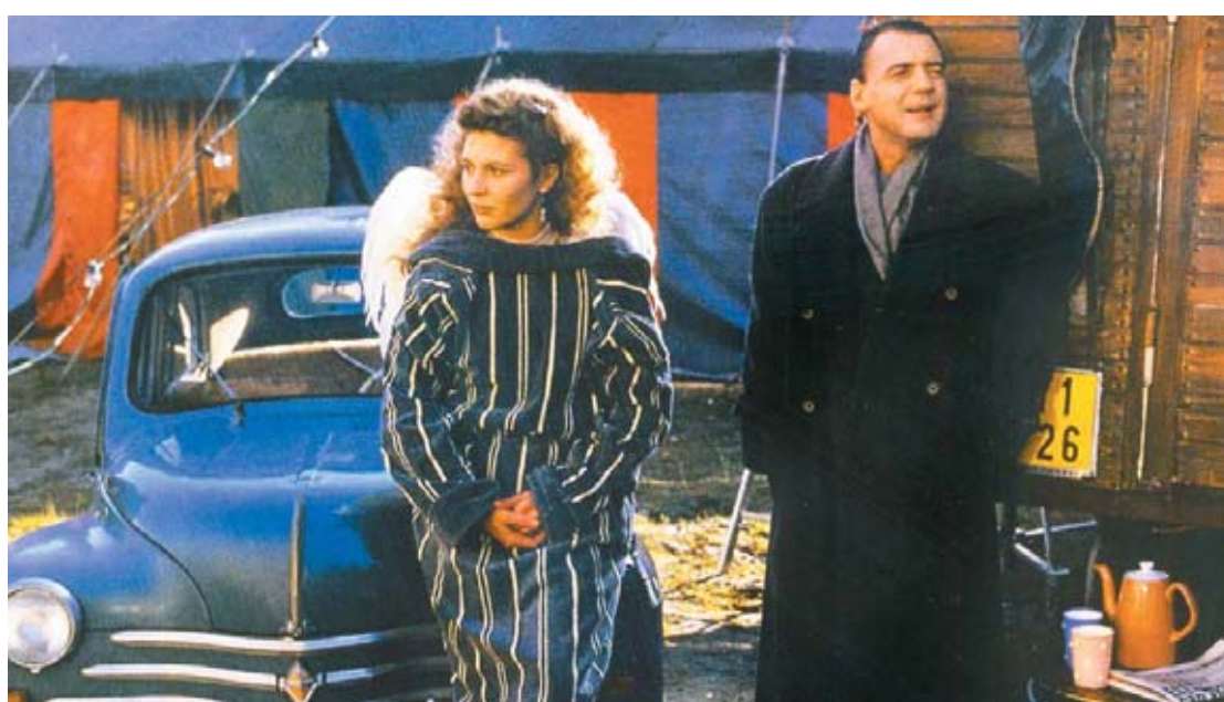
○ DOIS LADOS da mesma história, a fábula alemã "Asas do Desejo", de Wim Wenders, ganhou ares de drama e romance na versão americana "Cidade dos Anjos"

ca, mas ambas apresentam problemas quanto aos critérios e categorias que se sobrepõem. A do americano possui 15 itens: "filmes mudos refeitos em sonoros", "filmes mudos refeitos pelo mesmo diretor como sonoro", ou "refeito em outro país" etc. A do italiano possui somente três categorias: "as inúmeras versões da indústria que nasceu com o cinema", "filme com diégese forte", "filmes de gêneros", terminando por classificá-lo como uma espécie de supergênero, que abrigaria uma variedade destes.