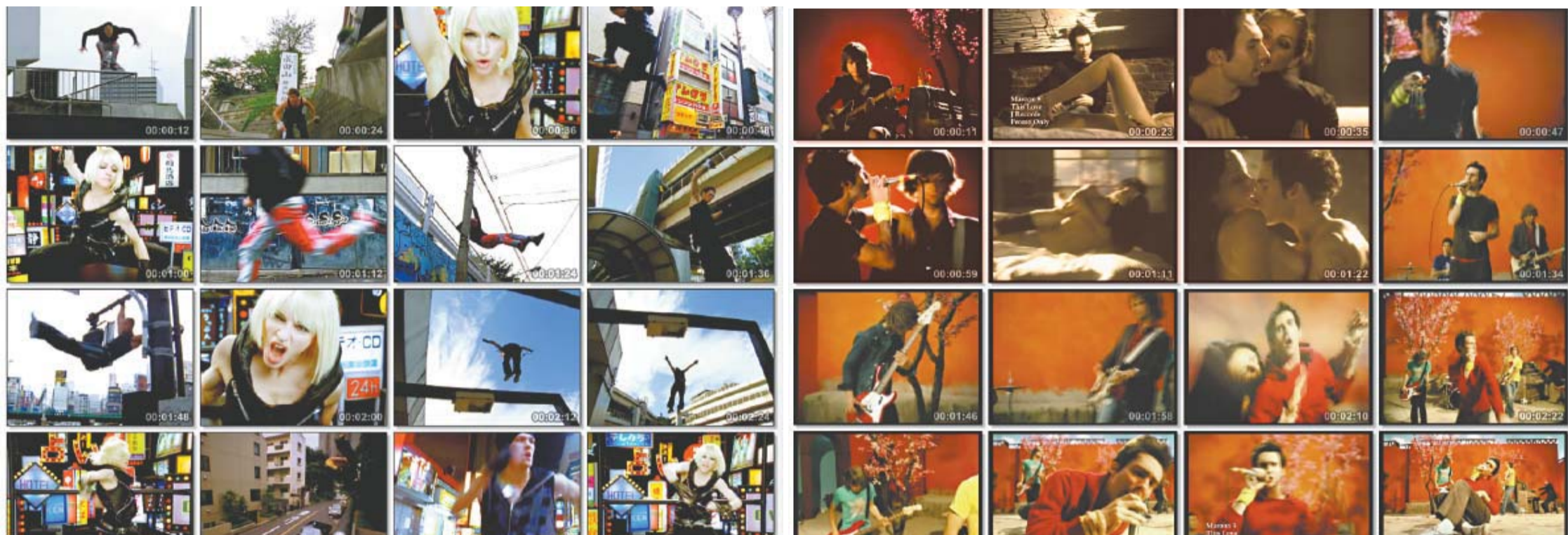
Colagem e fragmentação: artistas pop atrelados a gêneros musicais variados fazem do videoclipe uma forte ferramenta de divulgação que envolve as indústrias fonográfica e audiovisual