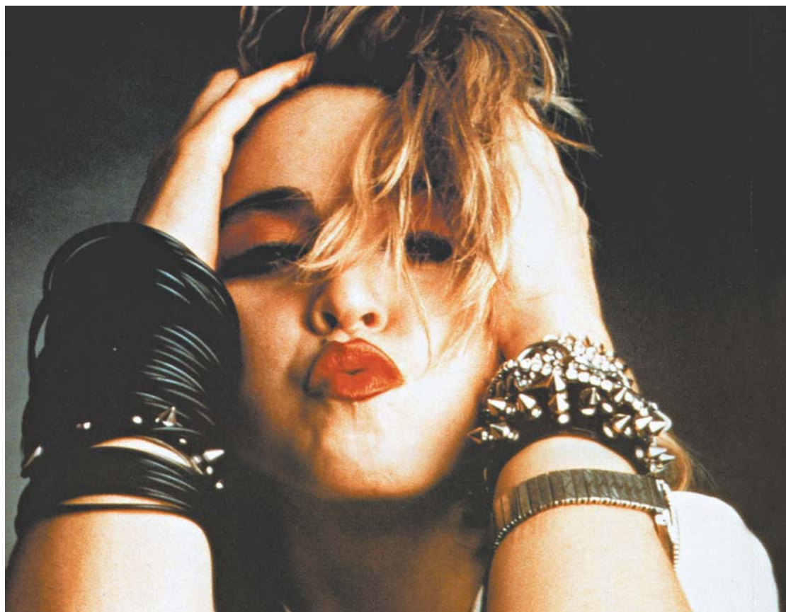
↑ AS COLETÂNEAS MAPEIAM a carreira de Madonna em todas as suas fases, do pop oitentista à maturidade, cool e dançante e situa a artista como maior ícone pop da atualidade