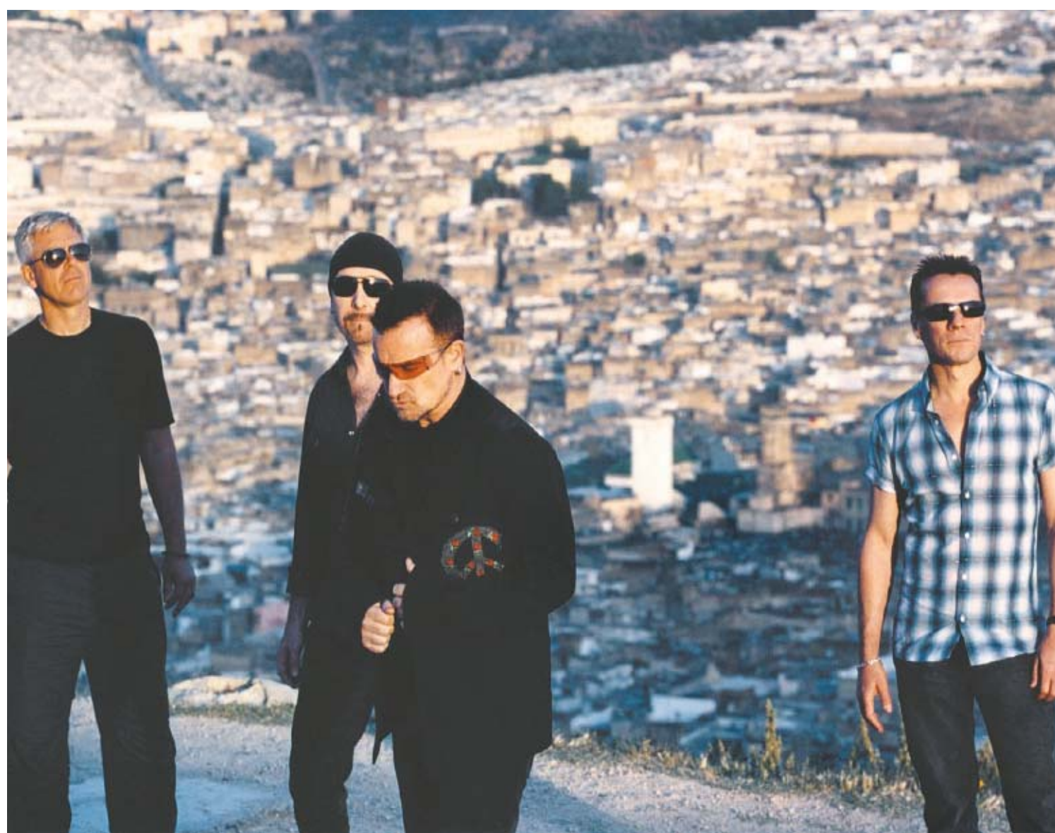
HORIZONTE SEM FIM: os quatro integrantes do U2 estão lançando um novo álbum menos comercial e sem o mesmo impacto de importantes trabalhos do passado da banda

Quatro anos depois de "How to Dismantle an Atomic Bomb", Bono, The Edge, Adam Clayton e Larry Mullen estão de volta com "No Line on The Horizon", a nova